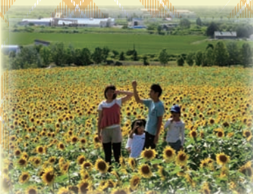
満開のひまわりの中で♪