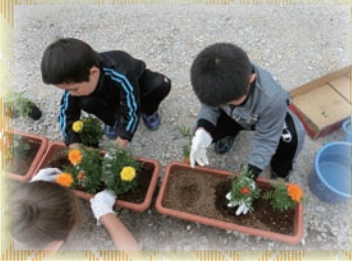
玄関前をお花で綺麗に!