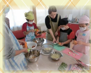
収穫祭のひとこま