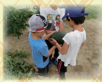
スイカ作りにチャレンジ