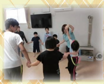
みんなでフープくぐり