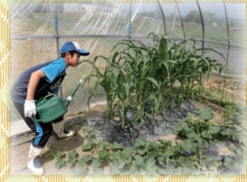
「実はついたかな～(夢中)」