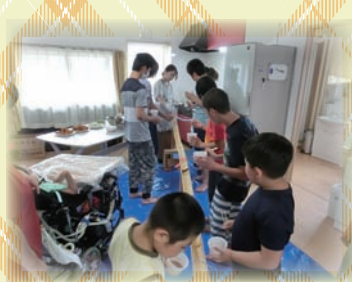
毎年恒例! 流しそうめん